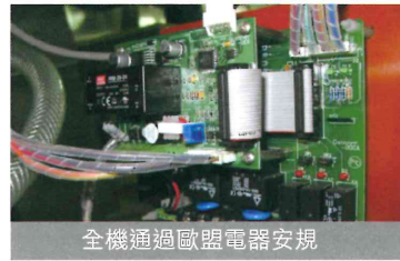
全機通過歐盟電器安規