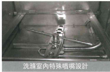
洗滌室內特殊噴嘴設計