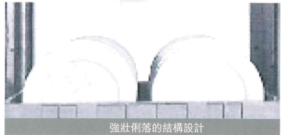
強壯俐落的結構設計