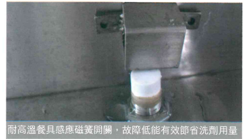
耐高溫餐具感應磁簧開關，故障低能有效節省洗劑用量