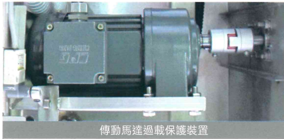
傳動馬達過載保護裝置

市場多年嚴峻考驗及淬煉下，不斷研發改良，強化結構性，提高洗滌品質。不僅有在地化生產優勢，價格更具競爭力外，並通過歐盟CE認證、食品安全衛生管理HACCP認證，行銷多國，真正做到國際規格本土價格。